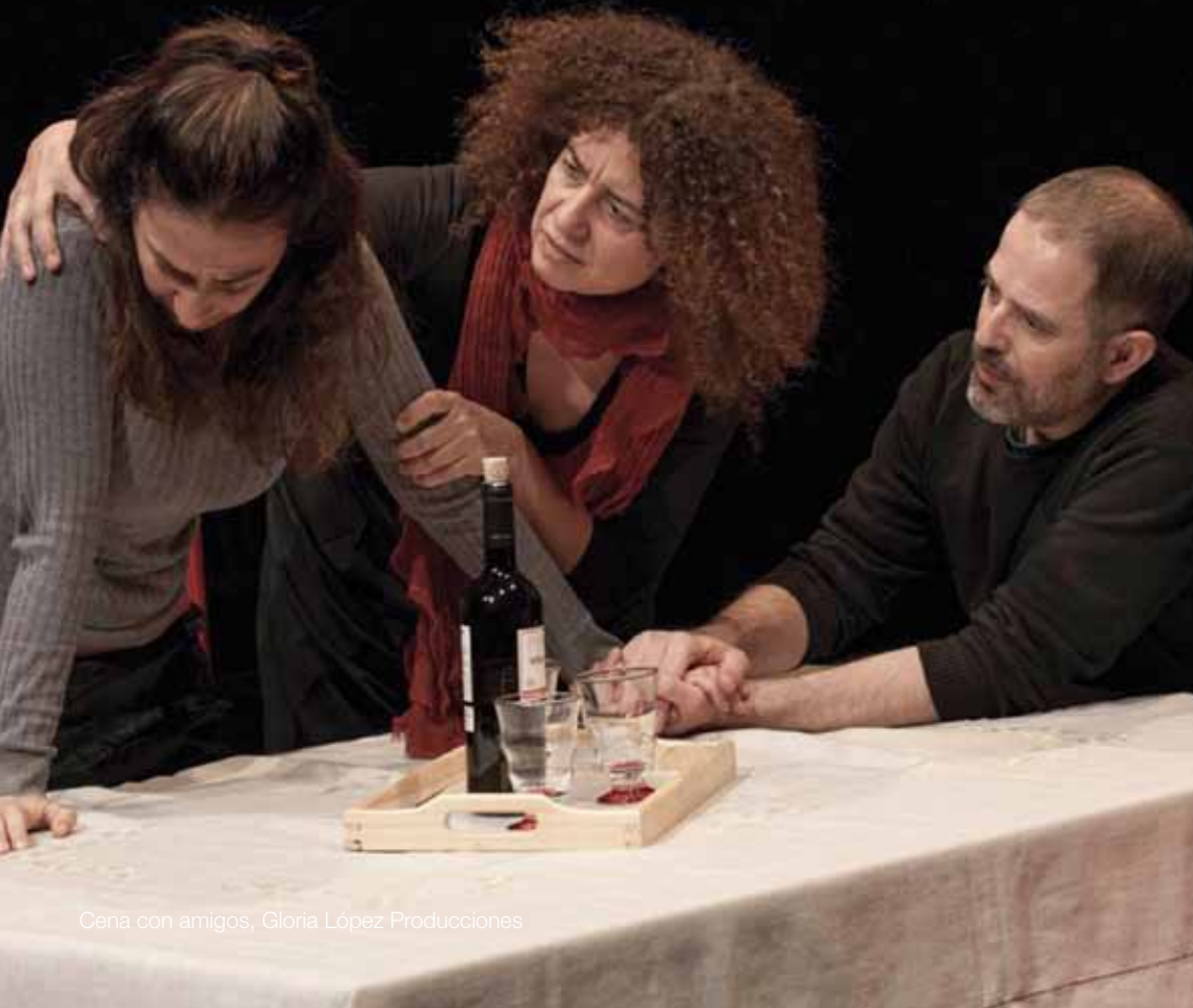
Cena con amigos, Gloria López Producciones